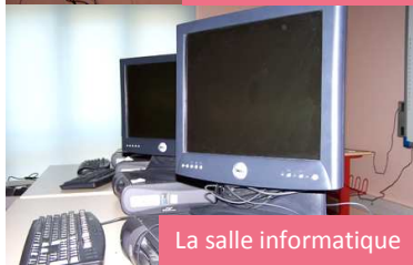
La salle informatique