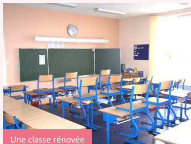
Une classe rénovée