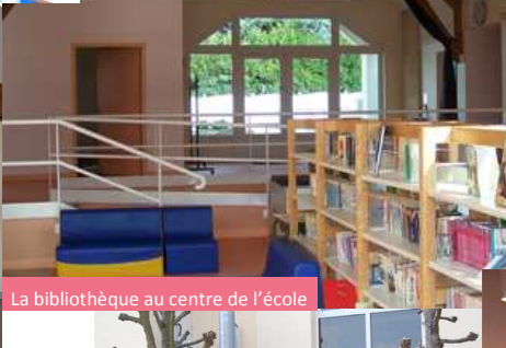
La bibliothèque au centre de l'école