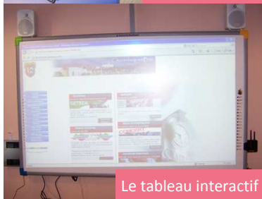
Le tableau interactif