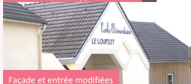
Façade et entrée modifiées