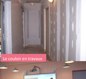
Le couloir en travaux