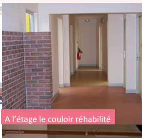
A l'étage le couloir réhabilité