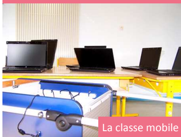
La classe mobile