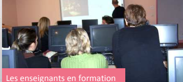
Les enseignants en formation