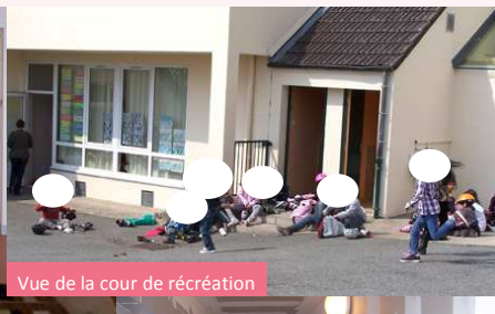
Vue de la cour de récréation