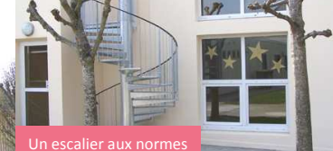
Un escalier aux normes