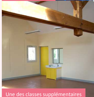
Une des classes supplémentaires