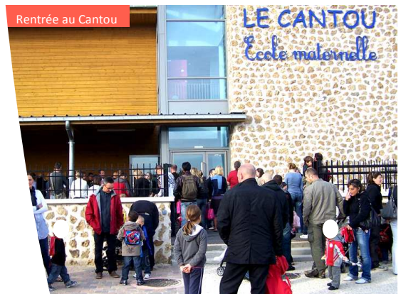
Rentrée au Cantou