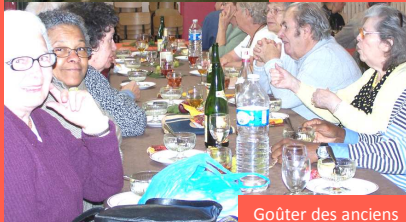
Goûter des anciens