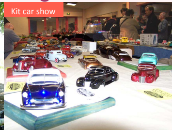
Kit car show