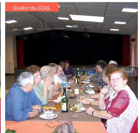
Goûter du CCAS