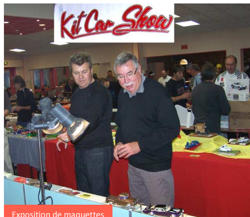
Exposition de maquettes