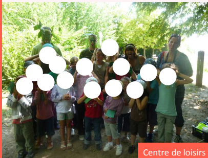
Centre de loisirs