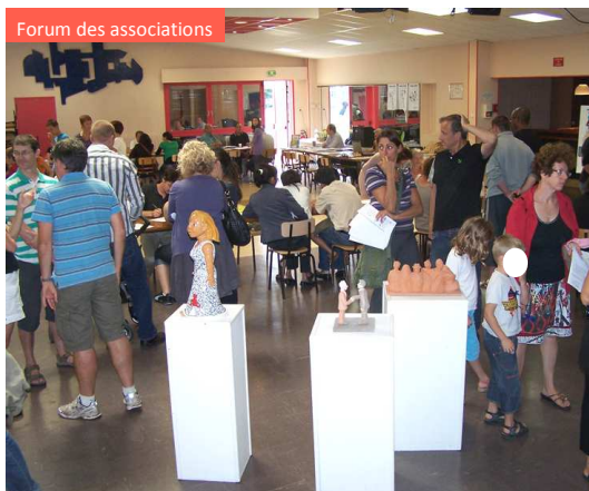
Forum des associations