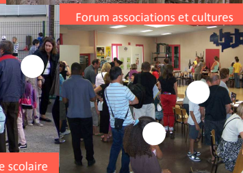
Forum associations et cultures