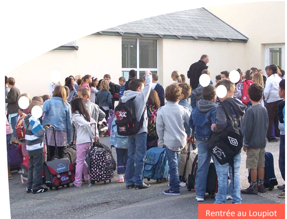
Rentrée au Loupiot