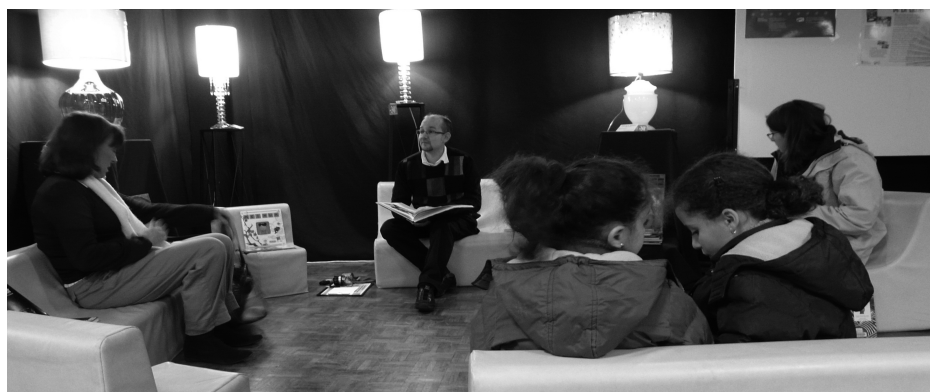
Le Coin lecture mis en lumière par le Club de la verrerie , créations Lazzaroni.

Des fourmis dans les jambes ? La municipalité vous invite à une découverte multidanses le vendredi 8 mai. Cette initiation gratuite concerne les genres classique, Street-Dance et Modern Jazz. Les adultes, adolescents et enfants (5/7 ans) seront les bienvenus à la salle Van Dongen de 14h à 18h.