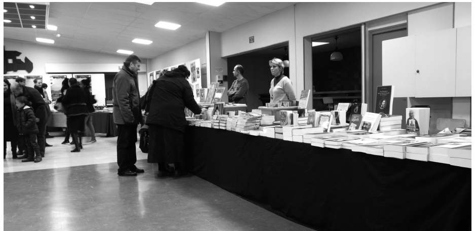
La librairie Marqu'ta page à l'œuvre !