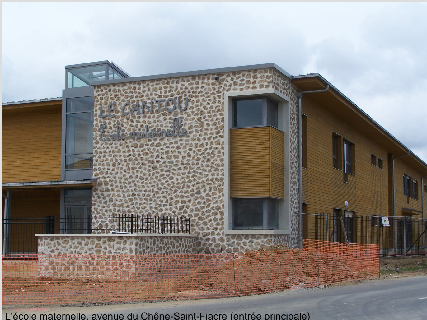
L'école maternelle, avenue du Chêne-Saint-Fiacre (entrée principale)