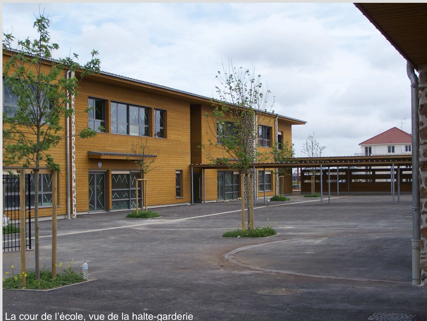
La cour de l'école, vue de la halte-garderie