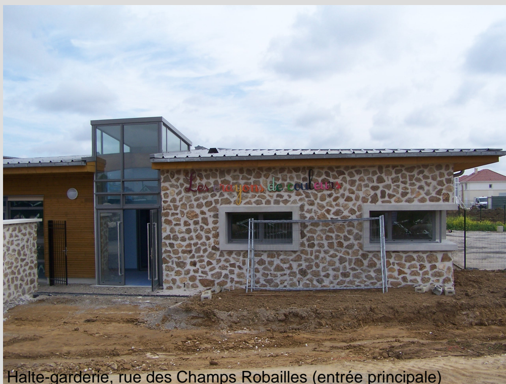
Halte-garderie, rue des Champs Robailles (entrée principale)