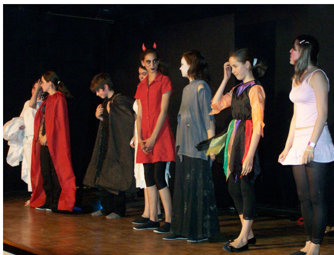
Pendant la représentation : les comédiens brûlent les planches, surtout quand l'unité de lieu n'est autre que... L'Enfer !!!