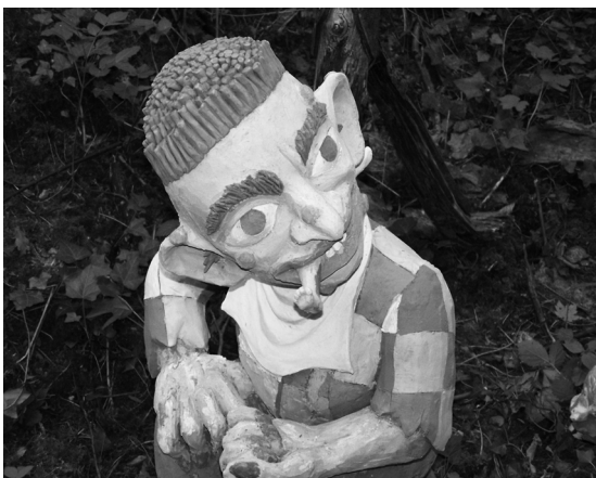
Il n'a pas l'air si méchant cet ogre ?