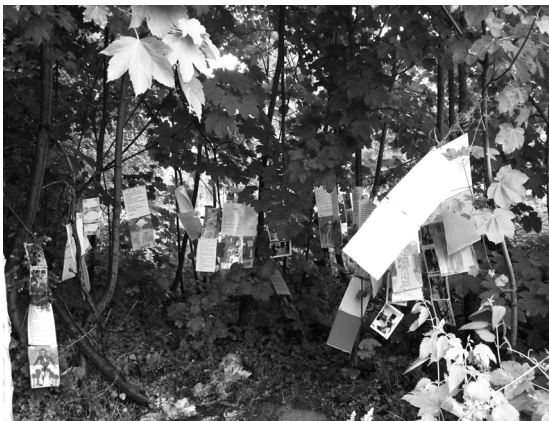
Les enfants ont aussi réalisés des textes et des dessins.