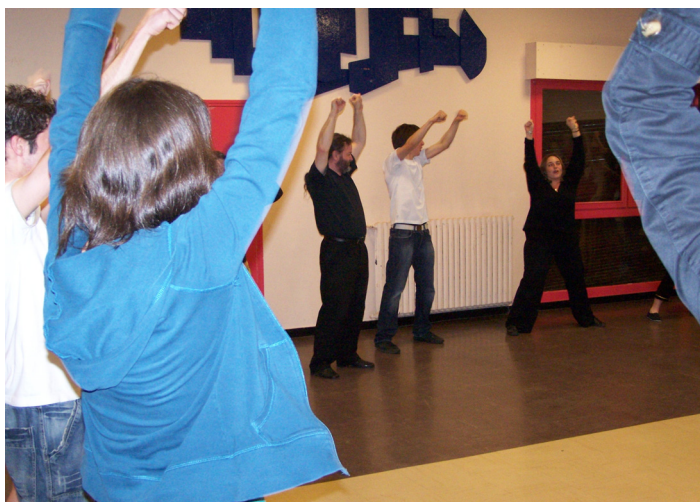
Avant la représentation : séance de motivation pour la troupe des ados.

A raison d'une séance par semaine, d'octobre à mai, vous obtiendrez peut-être de fabuleuses représentations comme sur la scène de Van-Dongen depuis maintenant sept ans. Mais la recette ne dit pas tout... Gardons le silence sur les coulisses, les angoisses et le stress d'avant spectacle. Combien d'énergie, de passion, de savoir-faire réunis pour que la scène soit belle ? Le mode d'emploi ne le précise pas mais le public est toujours là.