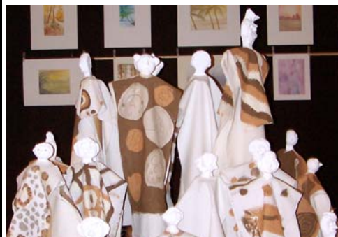
Nomades : Œuvre collective réalisée par les enfants (6-11 ans) des cours d'arts plastiques de Chanteloup-en-Brie. Retrouvez prochainement les Nomades à Lagny dans les vitrines du centre ville.

Le temps passe et nous inaugurons aujourd'hui la 30 e exposition de peintures et de sculptures de CHANTELOUP-EN-BRIE. Nous avons une pensée reconnaissante pour ces pionniers de la culture qui se sont lancés, il y a 30 ans, dans l'organisation de l'exposition pour la première fois et pour tous ces bénévoles qui ont renouvelé l'expérience chaque année pour notre plus grand plaisir ; le service communal de la culture ayant repris le flambeau lors de l'exposition 2004.